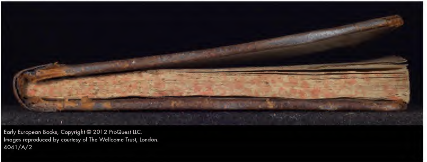
Early European Books, Copyright © 2012 ProQuest LLC. Images reproduced by courtesy of The Wellcome Trust, London. 4041/A/2